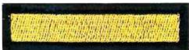
Пришивной нарукавный знак 1 год обучения