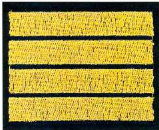
Пришивной нарукавный знак 4 год обучения