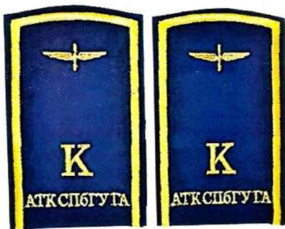
Нашивные наплечные знаки курсантов авиационно-транспортного колледжа