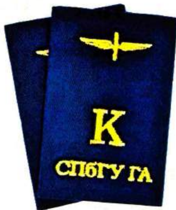
Съемные наплечные знаки курсантов Университета