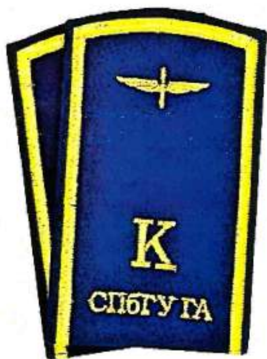
Нашивные наплечные знаки курсантов Университета