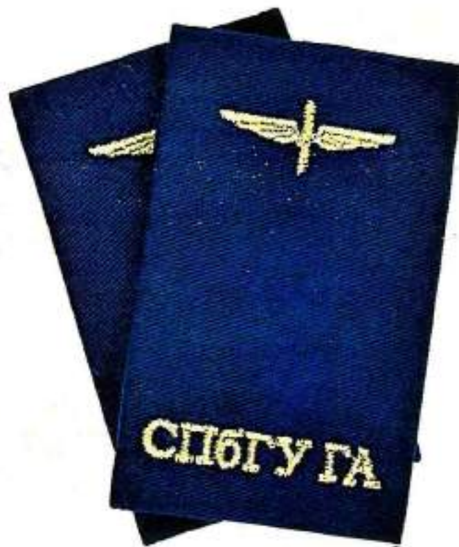
Съемные наплечные знаки обучающихся Университета