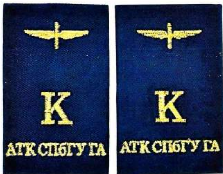
Съемные наплечные знаки курсантов авиационно-транспортного колледжа