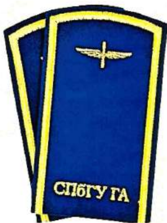
Нашивные наплечные знаки обучающихся Университета