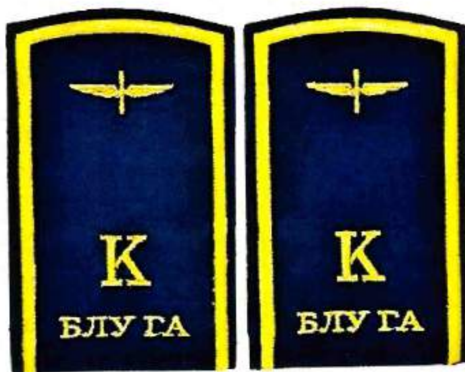
Нашивные наплечные знаки курсантов Бугурусланского филиала им. П.Ф. Еромасова СПБГУ ГА