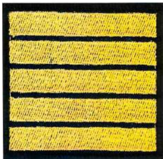
Пришивной нарукавный знак 5 год обучения