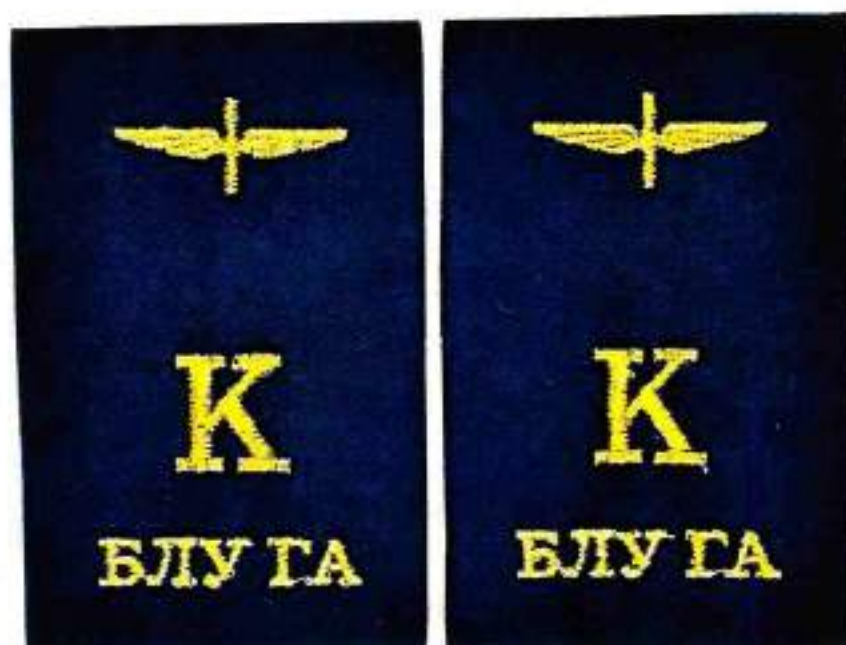
Съемные наплечные знаки курсантов Бугурусланского филиала им. П.Ф. Еромасова СПбГУ ГА