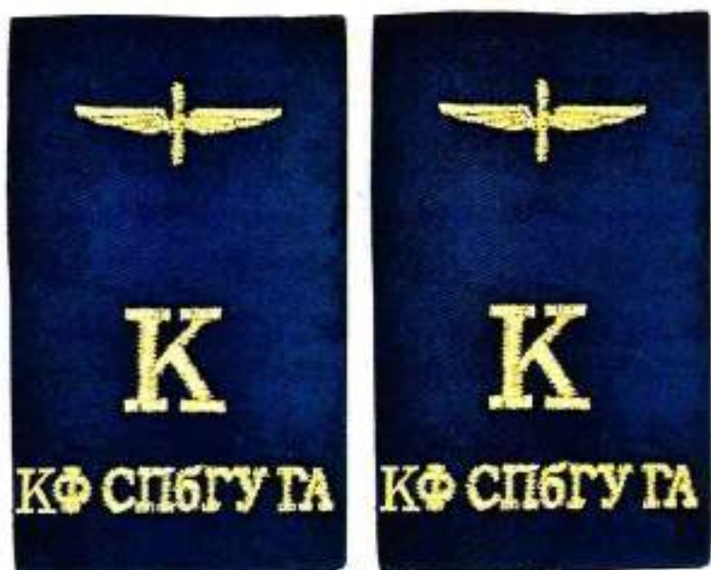
Съемные наплечные знаки курсантов Красноярского филиала им. В.С. Молокова СПбГУ ГА