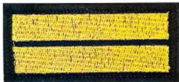
Пришивной нарукавный знак 2 год обучения