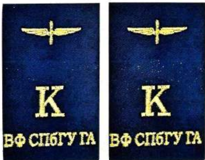
Съемные наплечные знаки курсантов Выборгского филиала им. С.Ф. Жаворонкова СПбГУ ГА