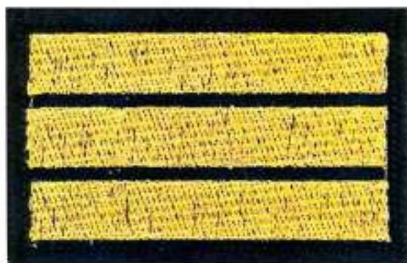
Пришивной нарукавный знак 3 год обучения