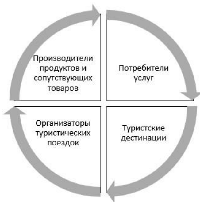
Рисунок 4 - Взаимодействие системных компонентов, из которых состоит организация туристской деятельности

Диаграммы также являются разновидностью рисунков, оформляемых в дипломе. Они бывают столбиковыми, секторными и диаграммами Венна. Основными требованиями к диаграммам являются четкость, наглядность,